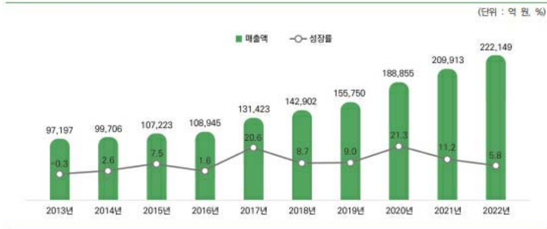
그림 1-1-1-1 국내 게임시장 전체 규모 및 성장률(2013~2022년)